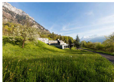
Ort mit Weitsicht: das «Mattli» in Morschach.

So, 25.6., 09.30 Uhr, Klosterkirche St. Urban, alle Teilnehmer sind anschliessend zu einem Apéro eingeladen. Weitere Informationen bei bruno.huebscher@lukath.ch , 041 419 48 42.